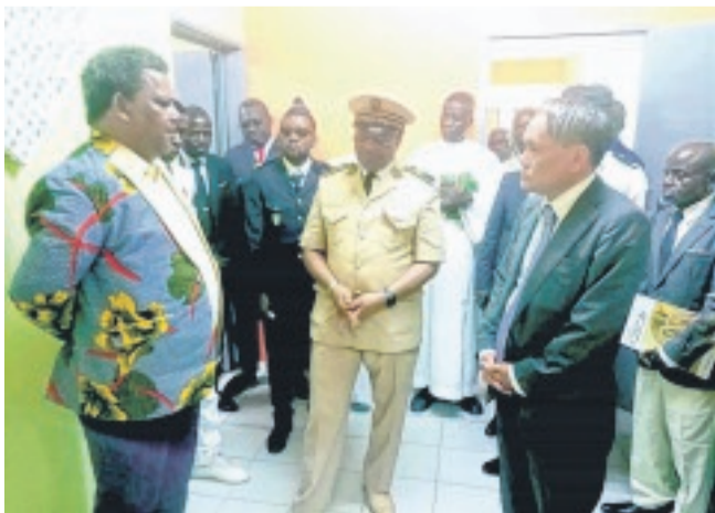
L'ambassadeur du Japon écoutant attentivement les explications d'un expert.

Le "programme dons aux microprojets locaux contribuant à la sécurité humaine" est ouvert à toutes les organisations non lucratives destinées aux besoins essentiels des populations de base.